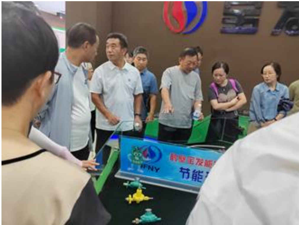
图 222023 师生进企业考察

突出重点带动全体。学校制定了专业带头人、骨干教师培养计划，以及骨干教师、青年教师培训制度，积极组织教师参加各级培训，参加培训教师的名额下发到各专业处，由各专业处推荐，校长办公会议研究确定公布。培训侧重向专业带头人、骨干教师、优秀青年教师倾斜，用足名额。