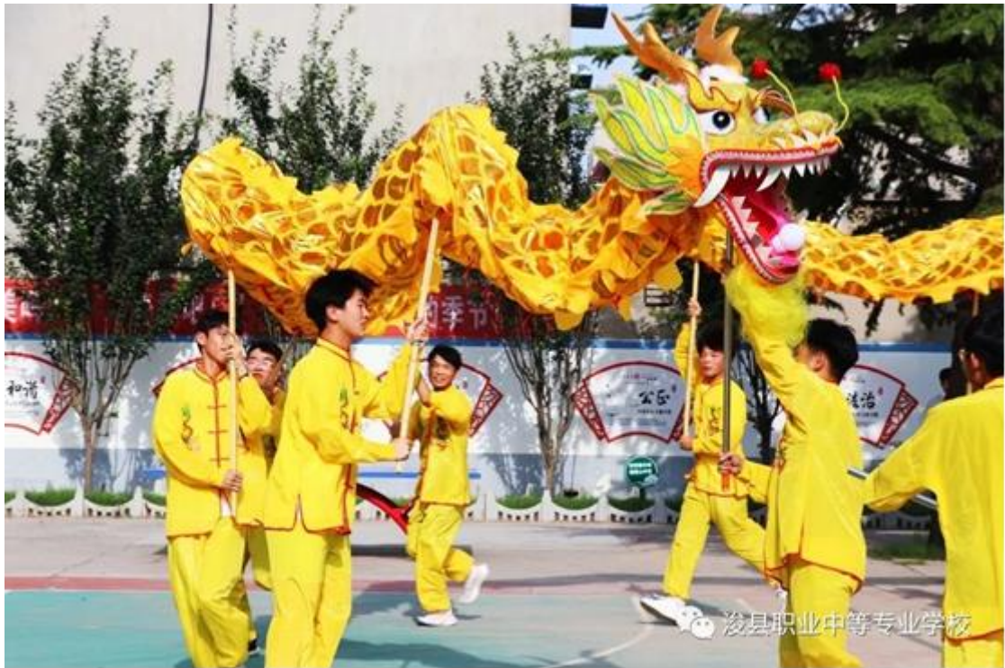
图 31 学生舞龙表演