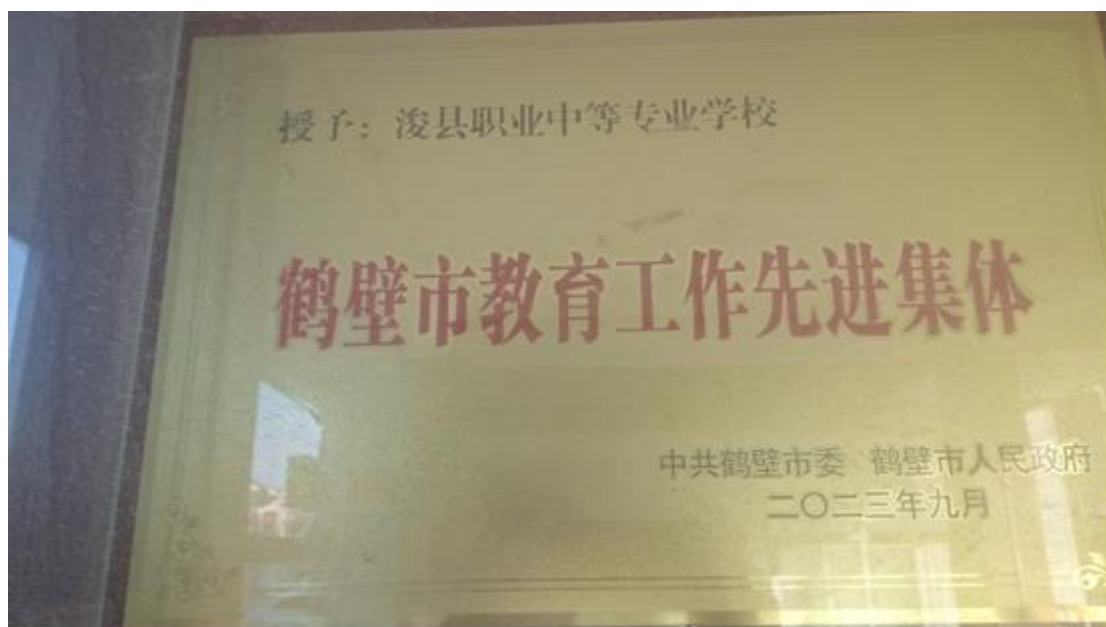
图 8 学校被鹤壁市委市政府授予鹤壁市教育工作先进集体

三项指标均显著提高，以学生为中心的教学改革工作初见成效，被市委市政府授予“鹤壁市教育工作先进集体”，被市教育局评为教育教学研究先进单位。