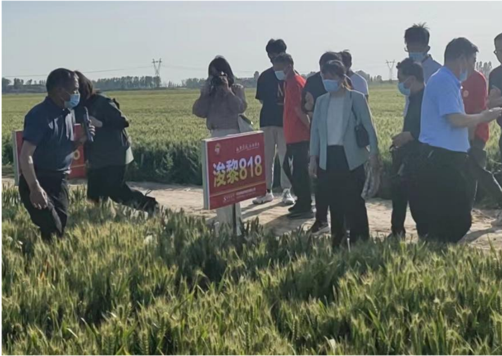
图 13 现代农艺专业处师生在校企共建试验田进行实践教学