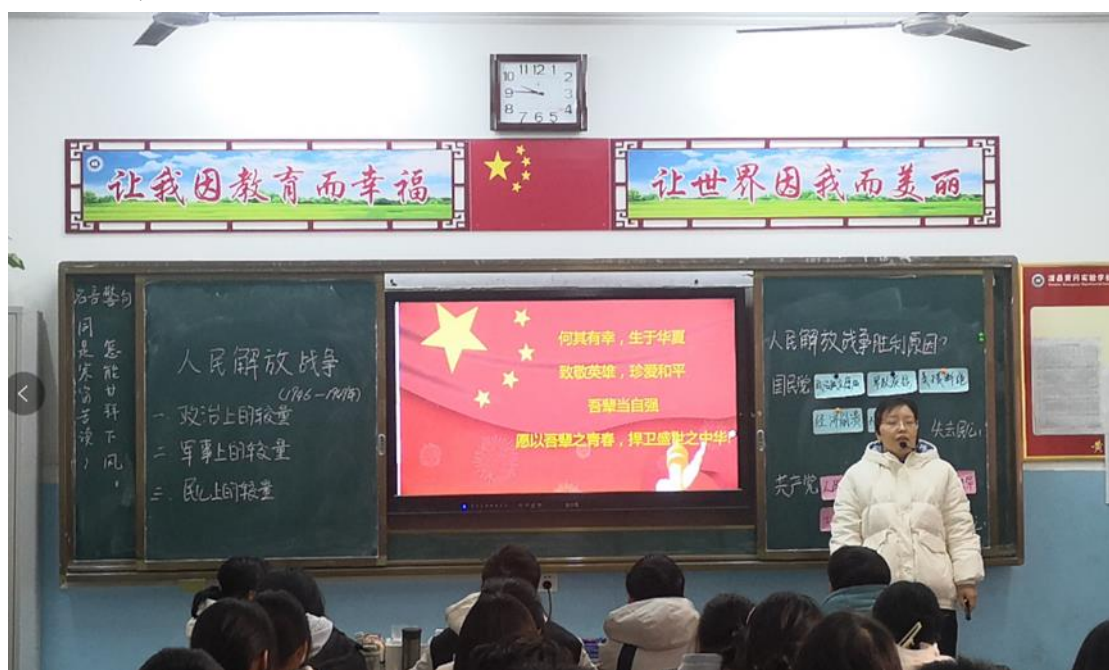
图 17 优质课评选活动

三是以课程思政建设为抓手，将课程思政融入日常专业教学中。学校加强政策、经费、人员保障，充分发挥教师队伍“主力军”、课程建设“主阵地”、课堂教学“主渠道”作用，推动形成专业课、基础课等各类课程与思政课程同向同行、专业教育和思政教育有机融合的课程思政育人大格局，全面提高人才培养质量。学校组织开展了校级课程思政教学创新大赛，推选出优秀选手参加市级比赛。