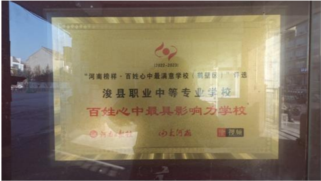
图 10 学校被河南日报社、大河报评选为百姓心中最具影响力学校