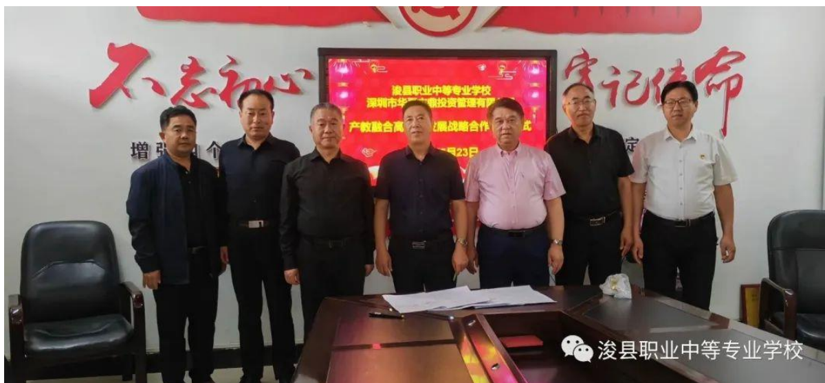
图 33 产教融合高质量发展战略合作签字仪式

此次校企双方正式建立产教融合关系，充分发挥了政府统筹、产业聚合、企业牵引、学校主体作用，深入探索了产教融合、工学结合的新模式，创新了“服务区域经济发展+学校定向专业人才培养”新渠道，有助于鹤壁市产教融合型城市试点建设。