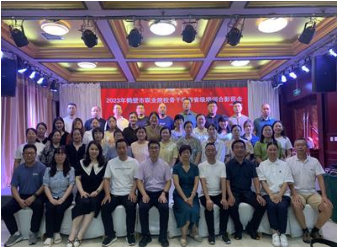
图 212023 鹤壁市骨干教师培训合影

企业实践提升能力。根据省厅制定的专业教师下企业实践的有关规定，学校组织教师按要求利用假期到相关企业实践锻炼。一年来，学校先选派 30 余名教师深入河南神华种业有限公司、河南商道种业有限公司、鹤壁天海电器集团、鹤壁仕佳光子科技股份有限公司等企业，学习新工艺、新技术、新方法，积极参与企业产品研发，专业能力得到了提升。