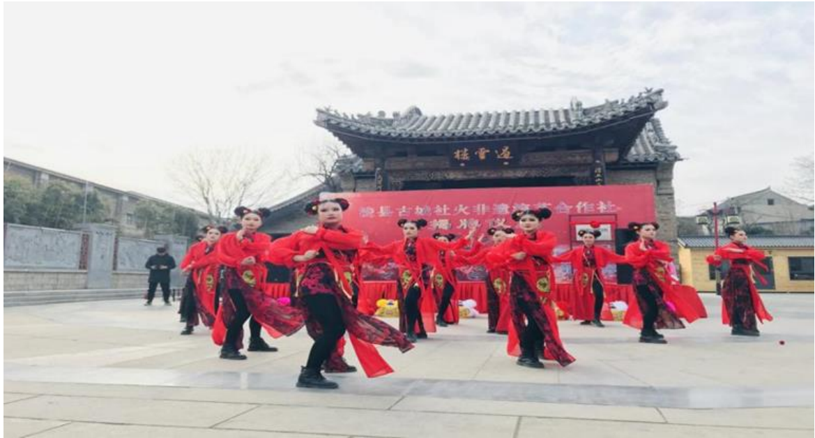
图 11 舞蹈社团参加社火表演