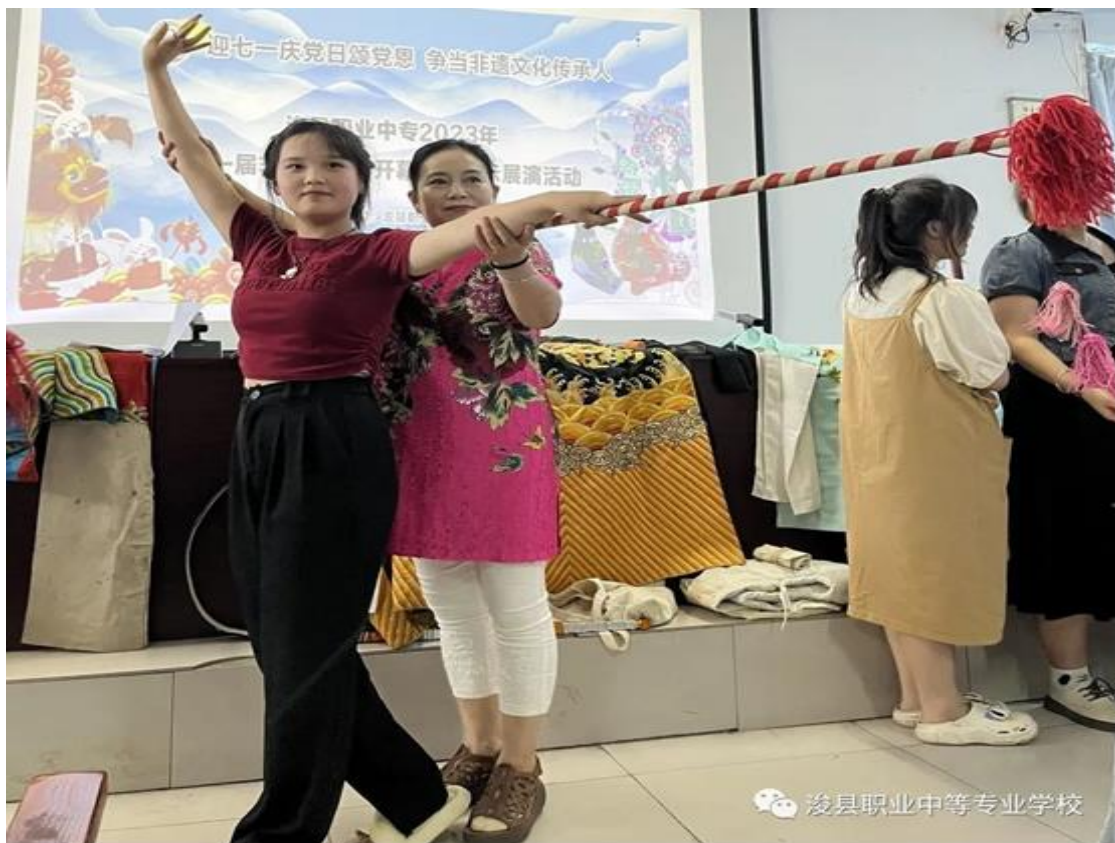
图 30 大平调非遗传承人到校授课