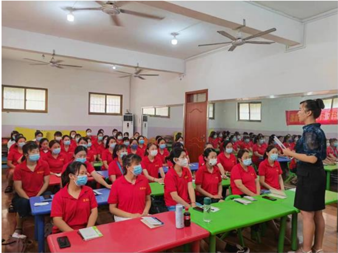
图 27 宣讲团成员下乡开展理论宣讲