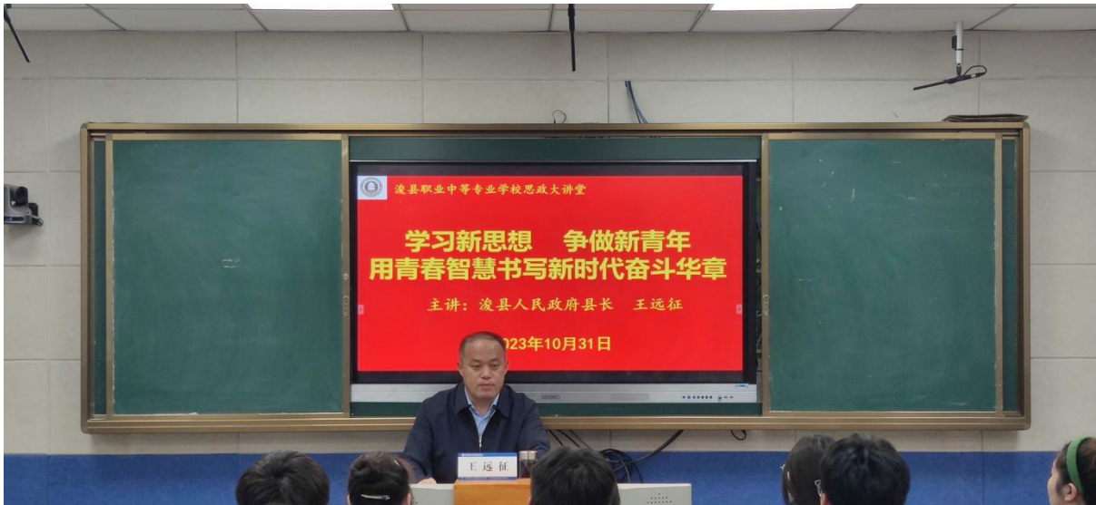
图3 浚县人民政府县长王远征到校上思政课