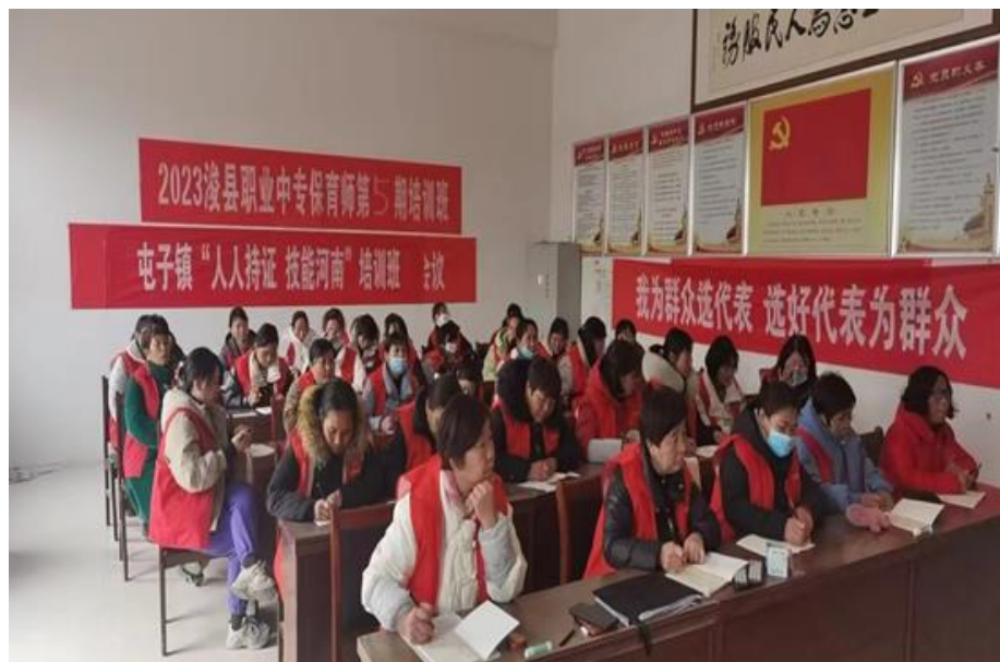
图 26 课堂掠影

浚县职业中专“金牌月嫂”培训借助“人人持证技能河南”的平台，为社会培训了大批高技能、高素质的优秀人才，实现了高薪就业，被评为 2023 年度省级“终身学习品牌项目”。