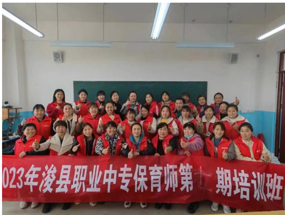
图 25 培训结束，老师学员亲切合影留念

浚县职业中专“金牌月嫂”培训借助“人人持证技能河南”的平台，为社会培训了大批高技能、高素质的优秀人才，实现了高薪就业，被评为 2023 年度省级“终身学习品牌项目”。