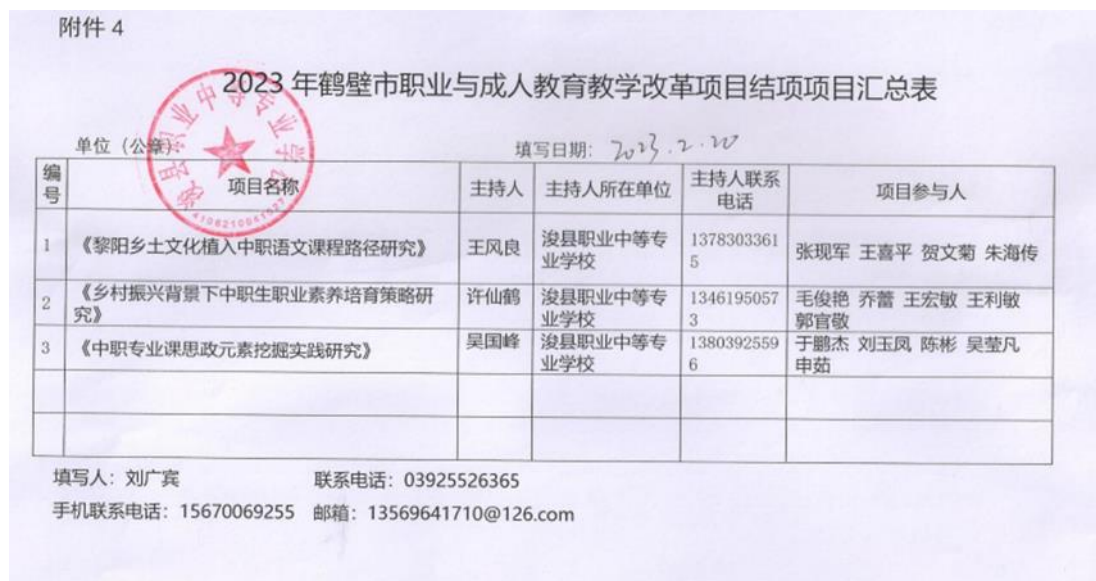
图 152023 年市级课题结项汇总表