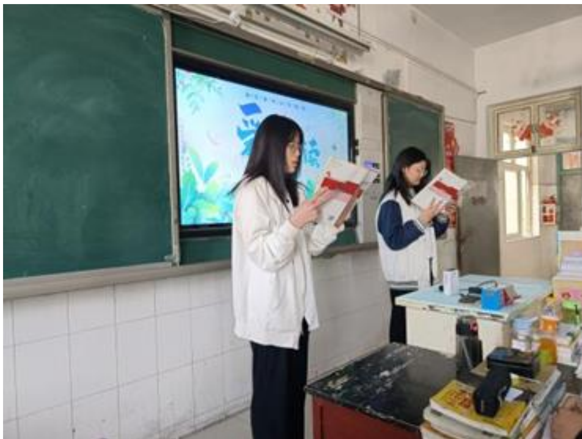
图 4 诵读经典诗文