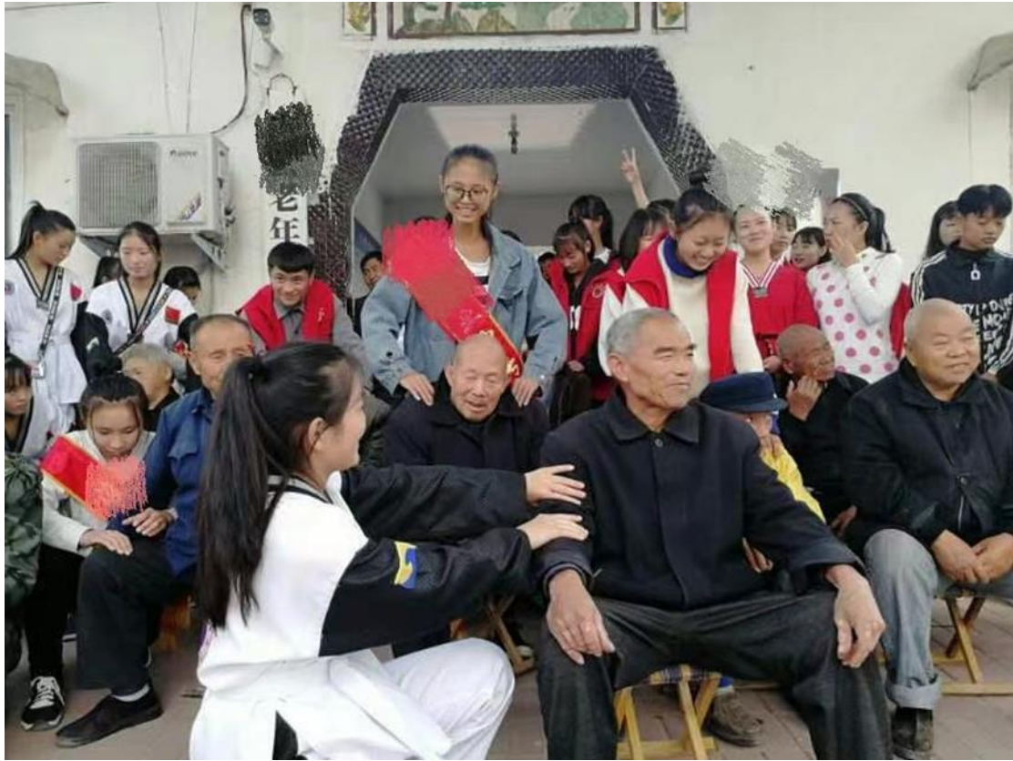
图 5 学生赴敬老院开展志愿服务