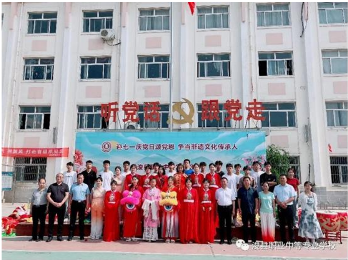
图 32 非遗文化节师生合影