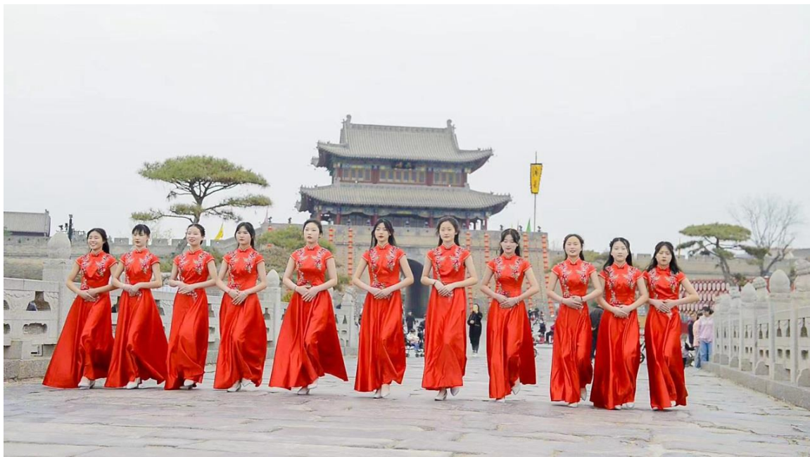
图 12 礼仪社团参加古城活动